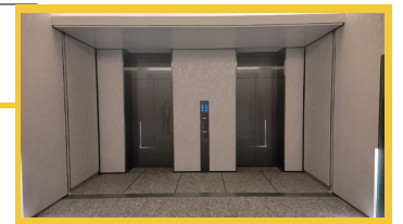
エレベーター(表動線)を使って4階ホールへ