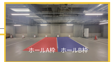
ホールA枠 ホールB枠